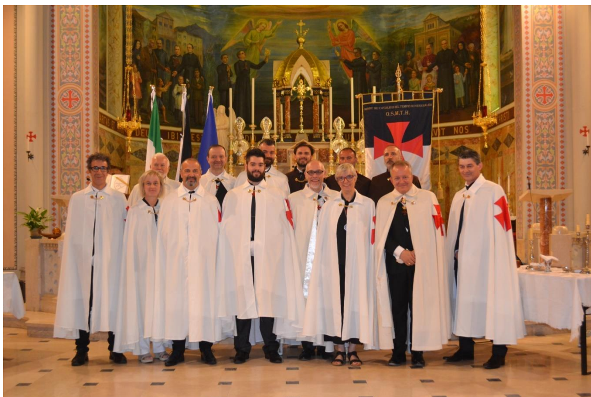
Foto di gruppo dei membri dell'Ordine