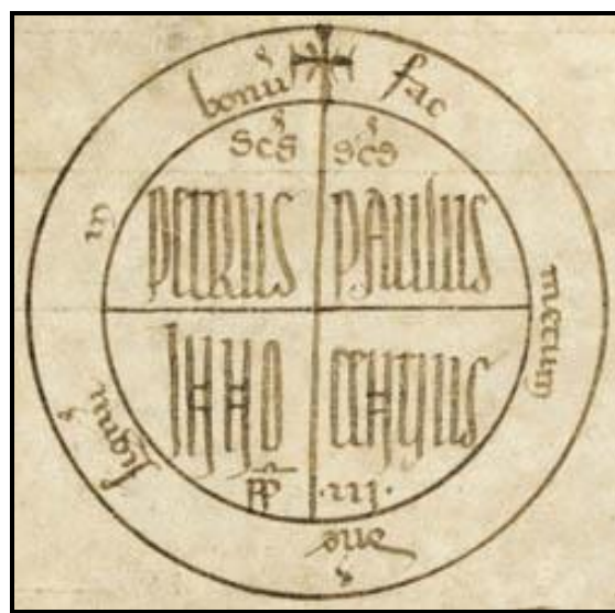
Parafa lui Inocentiu al II-lea (1198-1216)